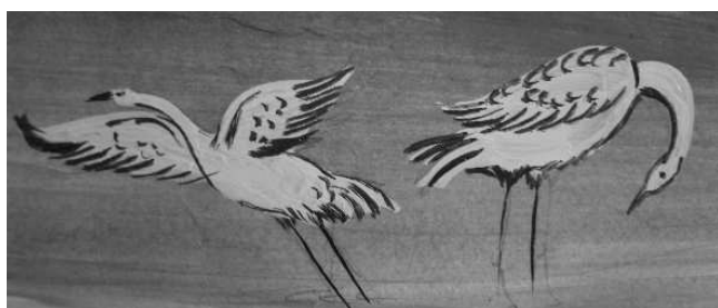
1-TIBETAN FRESCO - Détail - detalle - detail