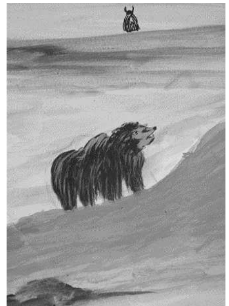
1-TIBETAN FRESCO - Détail - detalle - detail

Je prends soin de mon matériel de peinture.