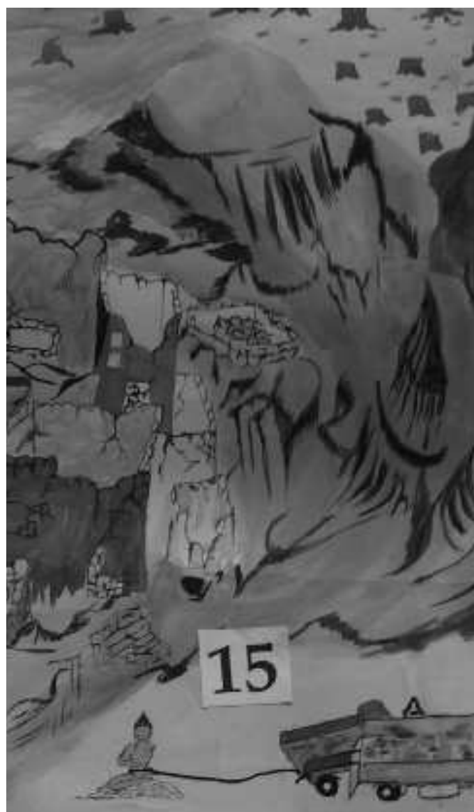
2-TIBETAN FRESCO - Détail - detalle - detail