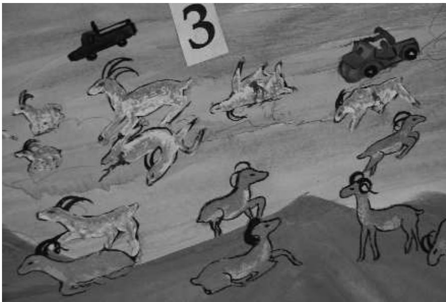
2-TIBETAN FRESCO - Détail - detalle - detail