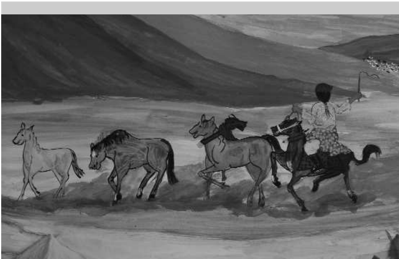
1-TIBETAN FRESCO - Détail - detalle - detail