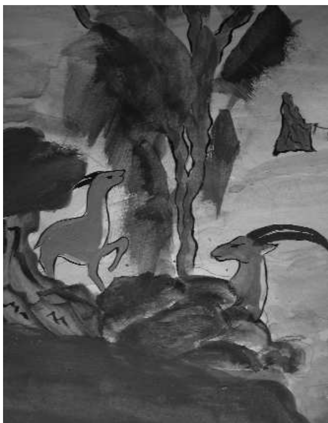
1-TIBETAN FRESCO - Détail - detalle - detail