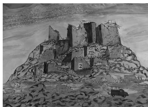
2-TIBETAN FRESCO - Détail - detalle - detail

Je vais essayer de peindre en utilisant mes couleurs en plus ou moins foncé.