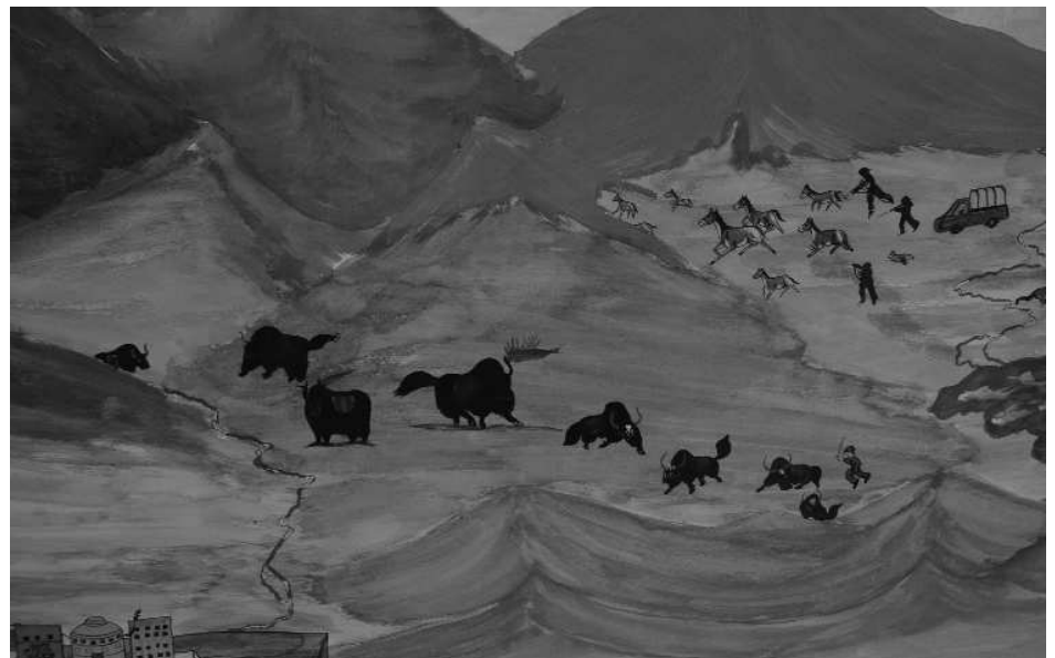
2-TIBETAN FRESCO - Détail - detalle - detail

Mes couleurs sont plus ou moins foncées. Si ma peinture était seulement en noir et blanc, je verrais mieux ce qui est foncé ou clair et les variations. En noir et blanc on ne distingue pas deux couleurs qui ont la même valeur.