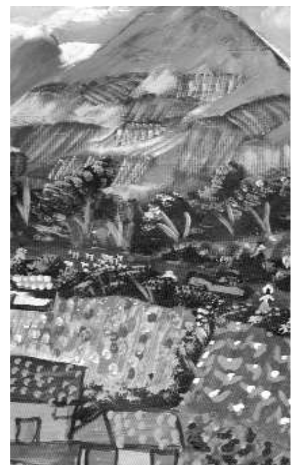
MURAL DE AMARU - Détail - detalle - detail